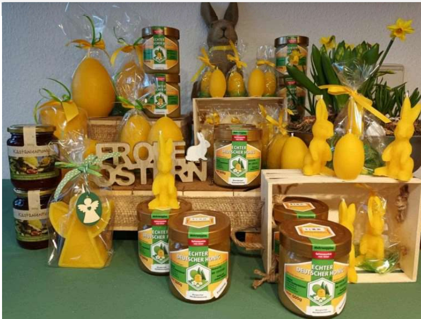
Wer sich bei Imker Daubenbüchel in Bensberg umsehen möchte, ist herzlich willkommen.

22.03.2024