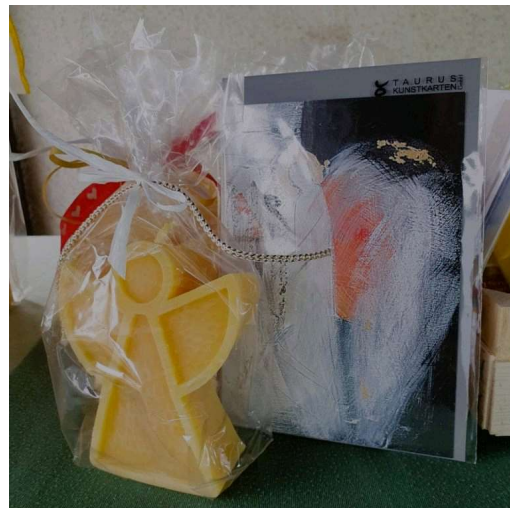
Bienenwachsengel (7,50€ pro Stück) erfreuen sich großer Beliebtheit. Nicht nur in der Weihnachtszeit, auch als Schutzengel, von freudigen bis traurigen Anlässen.

22.03.2024